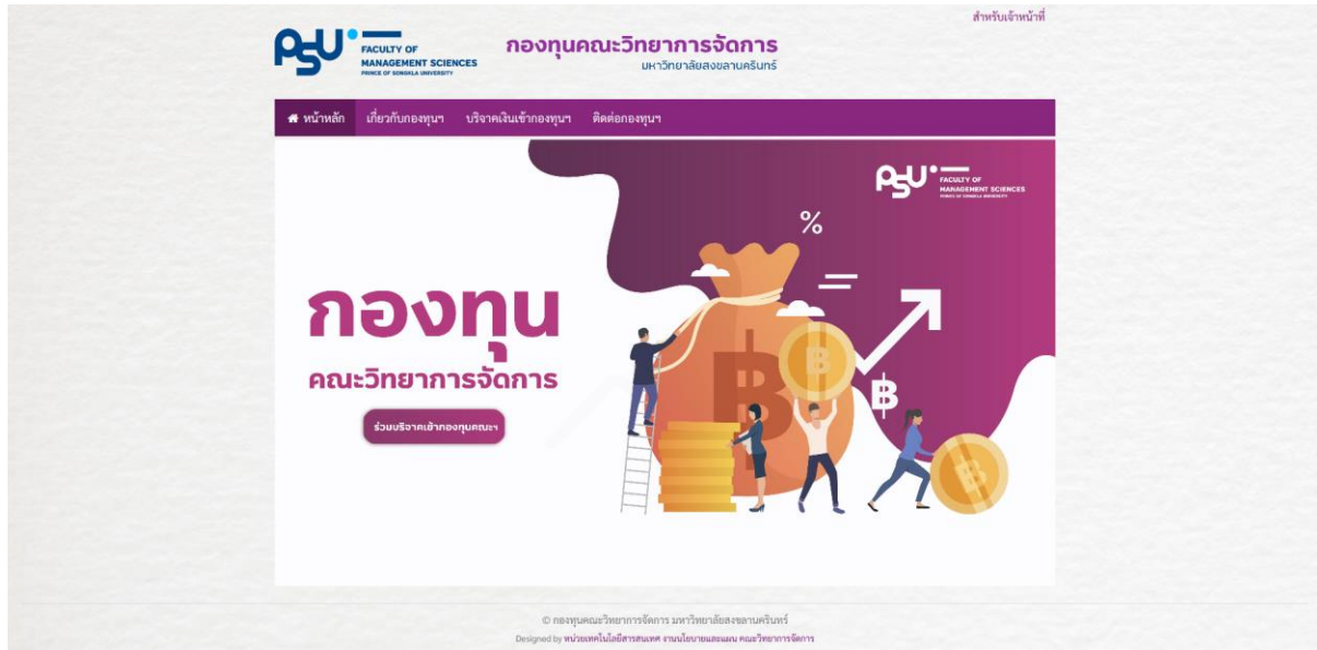
ภาพที่ 1 หน้าหลักของระบบกองทุนคณะวิทยาการจัดการ

ประกอบด้วยแบนเนอร์ประชาสัมพันธ์ของเว็บไซต์กองทุนคณะวิทยาการจัดการ