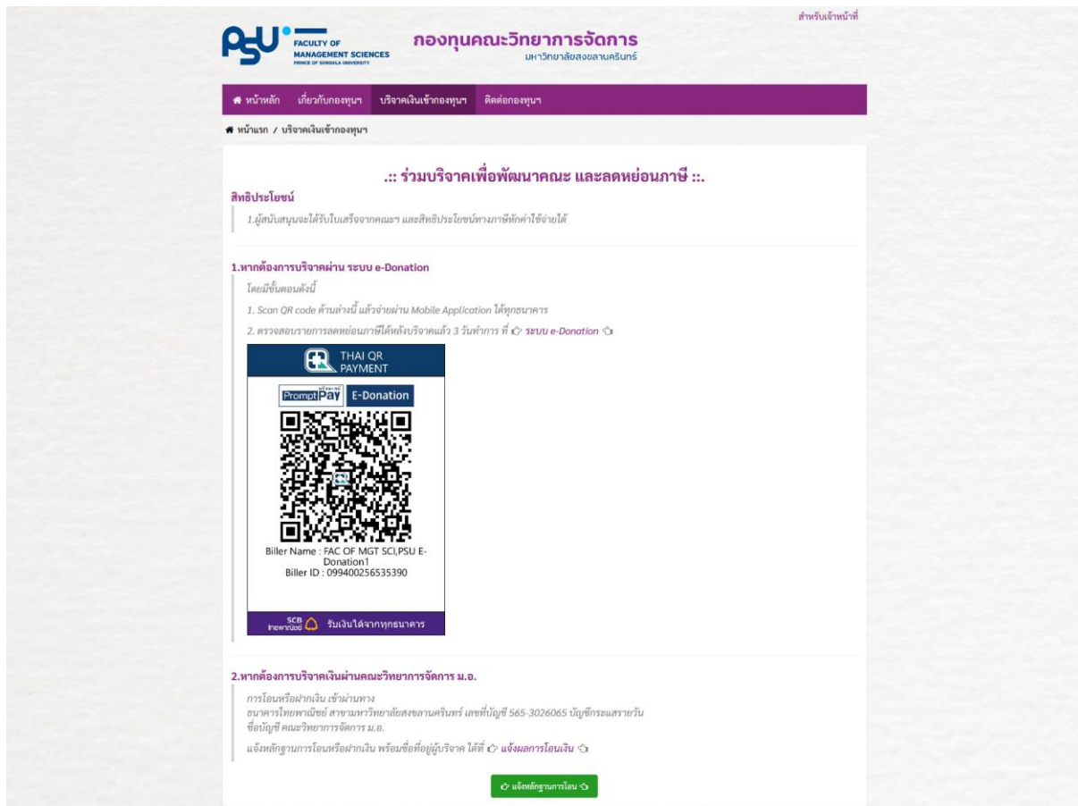
ภาพที่ 3 หน้าจอบริจาคเงินเข้ากองทุนฯ

สำหรับเมนูบริจาคเงินเข้ากองทุนฯ จะแสดงรายละเอียดสิทธิประโยชน์ รูปแบบการบริจาคเงิน รวมทั้งรายละเอียดขั้นตอนการบริจาคเงินเข้ากองทุนฯ ถ้าผู้ใช้งานต้องการบริจาคเงินเข้ากองทุนผ่านระบบ e-Donation ผู้บริจาคสามารถแสกน QR Code ได้จากระบบได้ทันที หากต้องการบริจาคผ่านการโอนเข้าบัญชีสามารถใช้เลขบัญชีได้จากเว็บไซต์ เมื่อผู้บริจาคทำการโอนเงินเรียบร้อยแล้ว สามารถแจ้งหลักฐานโดยคลิกที่ปุ่ม “แจ้งหลักฐานการโอน” เพื่อกองทุนฯ สามารถออกใบเสร็จรับเงินให้ผู้บริจาคตามรายละเอียดที่แจ้ง